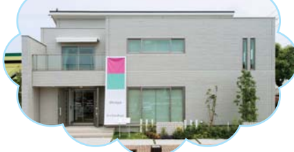
家は、性能。 一条工務店