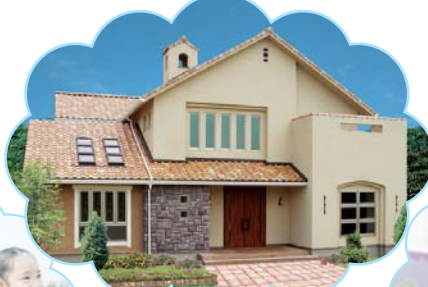
万人白色のHAPPYにお応えする住まいづくり エルクホームズ