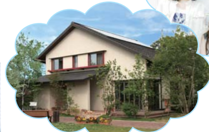
株式会社 安成工務店