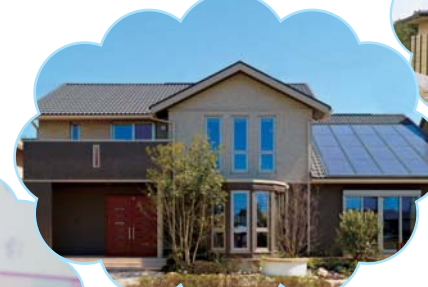
セキスイハイム中四国株式会社